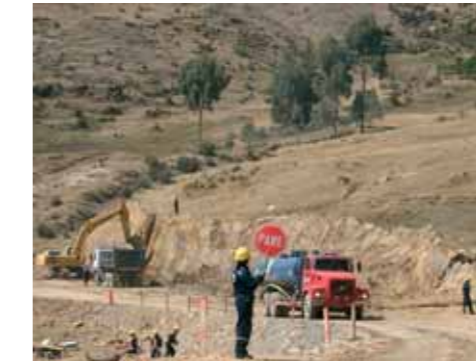
Ocongate, Carretera Interoceánica Sur

Es un colectivo igualitario de organizaciones no gubernamentales, instituciones académicas e individuos preocupados por los impactos directos e indirectos, sociales y ambientales, del asfaltado de la carretera Interoceánica Sur en el Perú. La preocupación del Grupo de Trabajo radica en que, en ausencia de planes y de inversiones significativas para un desarrollo sostenible en el ámbito de la obra, el asfaltado de la carretera estimula, por defecto, procesos socio-económicos destructivos y ya dominantes en la región, basados en la migración espontánea de colonos altoandinos a la selva, para ocuparse en la tala ilegal, la minería de oro informal y sumarse a un crecimiento urbano descontrolado. Esto viene agravando pasivos sociales y ambientales previamente existentes, como la carencia de servicios básicos, la deforestación improductiva, la invasión de las áreas protegidas y la contaminación de los ríos por mercurio.