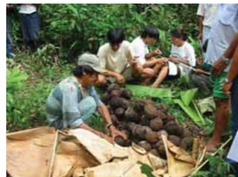
Conteo producción de cocos de castañas por árbol

Su existencia reconoce la enorme diversidad cultural y ecológica entre las regiones afectadas por la Interoceánica Sur; los distintos climas políticos regionales; así como la pericia, el talento y el tejido social nativos de cada región. Los grupos están organizados por prioridades regionales y comprometidos en promover el diálogo y la cooperación con las organizaciones de base y los gobiernos regionales y locales. A partir de Julio 2007, cada Grupo Regional cuenta con un Plan de Acción Anual que especifica prioridades y compromisos colectivos. Estos primeros Planes de Acción Anual son verdaderos mapas de las preocupaciones estratégicas de la sociedad civil en cuanto a conservación y desarrollo en cada región, así como radiografías de las capacidades colectivas. Una tarea central de los Grupos Regionales es informarse e informar permanentemente sobre las decisiones y procesos relacionados con la Interoceánica Sur, sobre todo en cuanto a las interrelaciones e interdependencias ecológicas, económicas y sociales entre las regiones conectadas por la Interoceánica Sur.