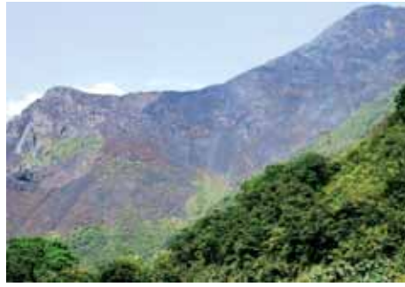
Quemas de pasto en Marcapata

la Interoceánica Sur, el Grupo de Madre de Dios, en cercana coordinación con el Gobierno Regional, dinamizó el proceso de observaciones técnicas a los Estudios de Impacto Socio-Ambiental para el Tramo 3, el proceso de revisión de los Planes Operativos Anuales 2007 del Programa CAF/INRENA y el cabildeo para fortalecer la participación regional en la gestión de dicho Programa. En este tema, promovió el diálogo y el consenso propositivo entre los gobiernos regionales de Madre de Dios, Cuzco y Puno. Además, el Grupo Regional junto con el Gobierno Regional y las federaciones indígena y campesina obtuvieron el rechazo de los Estudios de Impacto Ambiental de los Lotes de Hidrocarburos 111 y 113 preparados por la consultora GEMA, que contenían burdos plagios de estudios previos realizados en otra región. Finalmente, el Grupo, nuevamente al lado del Gobierno Regional y las organizaciones de base, actuó enérgicamente para proteger de la minería informal el Lago Valencia, el espejo de agua más extenso de Madre de Dios, principal enclave pesquero y territorio de comunidades indígenas y ribereñas. Actualmente, sobre la base de una agenda unificada, se discuten alternativas para zonificar y ordenar la actividad minera aluvial, y para proteger los ecosistemas palustres y lacustres de Madre de Dios en un sistema de conservación regional.