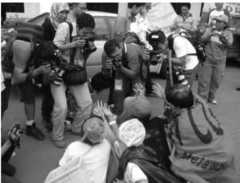
谴责世行政策的街头表演。 针对世行和国际货币基金组织的 国际人民论坛,2006